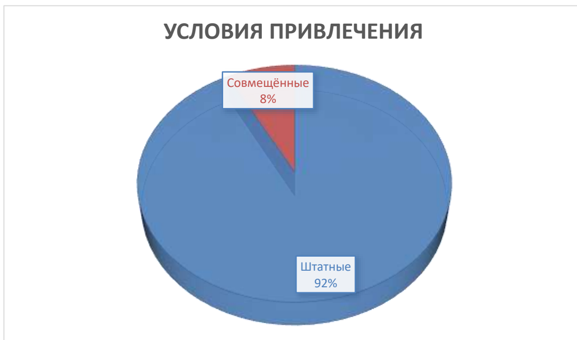
Рис. 4 «Условия привлечения»

Рисунок 4 показывает условия привлечения преподавателей. Как видно, большая часть - 12 преподавателей являются штатными, 1 – внешний совместитель.