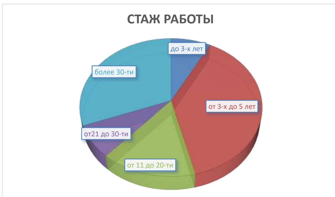
Рис. 3 «Стаж в лицее»

На рисунке 3 показан общий стаж работы преподавателей в лицее: «до 3 лет» - 1 человек; «3-10 лет» - 5; «11-20 лет» - 2; «21-30 лет» - 1; «более 30 лет» - 4.