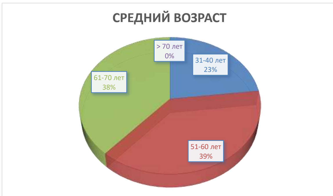
Рис. 2 «Возраст»

На следующий вопрос ответы респондентов распределились следующим образом: «21-30 лет» - 0; «31-40 лет» - 3 преподавателя; «51-60 лет» - 5; «61-70 лет» - 5; «более 70 лет» - 0. Средний возраст сотрудников составил – 47 лет.