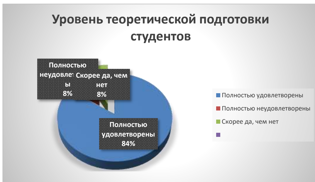
Рис. 3. Результаты оценивания уровня теоретической подготовки студентов (выпускников)

На вопрос «Как Вы оцениваете уровень теоретической подготовки студентов (выпускников)?» - дали следующие ответы: 84,6% полностью удовлетворены, а 7,7% полностью не удовлетворены теоретической подготовкой студентов (выпускников).