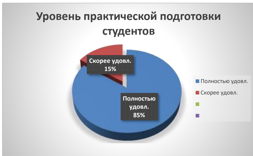
Рис. 4. Результат оценивания практической подготовки студентов (выпускников)

На вопрос «Как Вы оцениваете практическую подготовку студентов (выпускников)?» дали следующие ответы: 84,6% полностью удовлетворены, так же 15,4% ответили, что скорее удовлетворены.