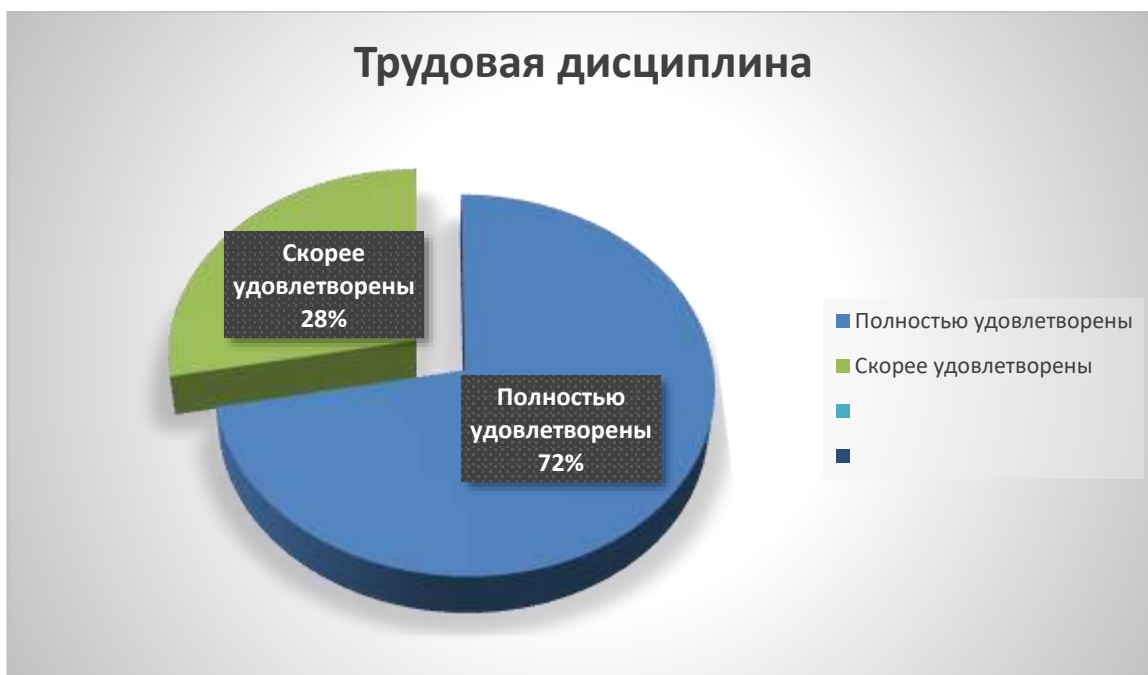
Рис. 5. Результаты удовлетворенности трудовой дисциплиной

На вопрос «Удовлетворены ли Вы трудовой дисциплиной студентов (выпускников)?» - 84,6% полностью удовлетворены, так же 15,4% ответили, что скорее удовлетворены.