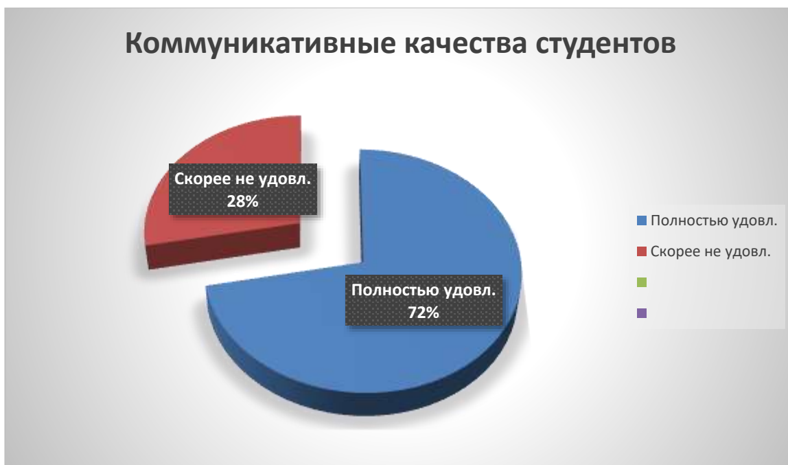
Рис. 6. Результат удовлетворенности коммуникативными качествами студентов (выпускников)

На вопрос «Удовлетворены ли Вы коммуникативными качествами студентов (выпускников)?» - 76,9% полностью удовлетворены коммуникативными качествами студентов (выпускников), а 23,1% скорее не удовлетворены.