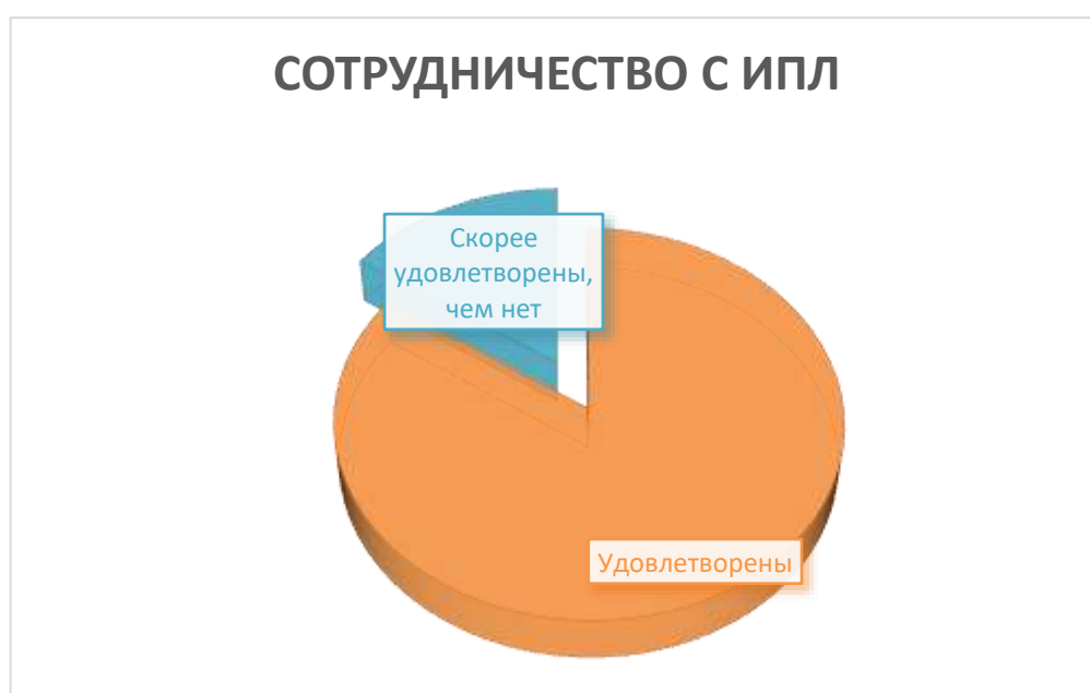
Рис. 1. Результаты удовлетворенности сотрудничеством

На первый вопрос «1. Удовлетворены ли Вы сотрудничеством с ГБПОУ СО «Ивантеевский политехнический лицей?»» 84,6% работодателей полностью удовлетворены сотрудничеством, 15,4% скорее удовлетворены сотрудничеством.