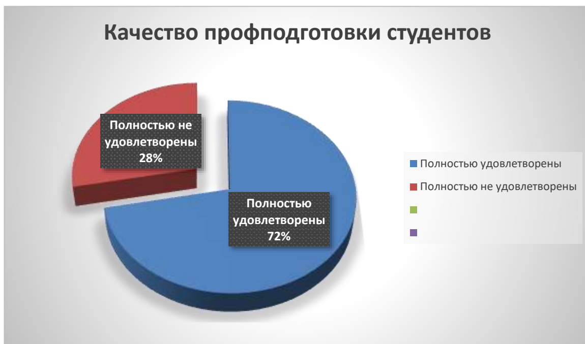
Рис. 2. Результаты удовлетворенности качеством профессиональной подготовки студентов (выпускников)

На вопрос «Удовлетворены ли вы качеством профессиональной подготовки студентов (выпускников)?» ответили, что 76,9% полностью удовлетворены, 7,7% полностью не удовлетворены.