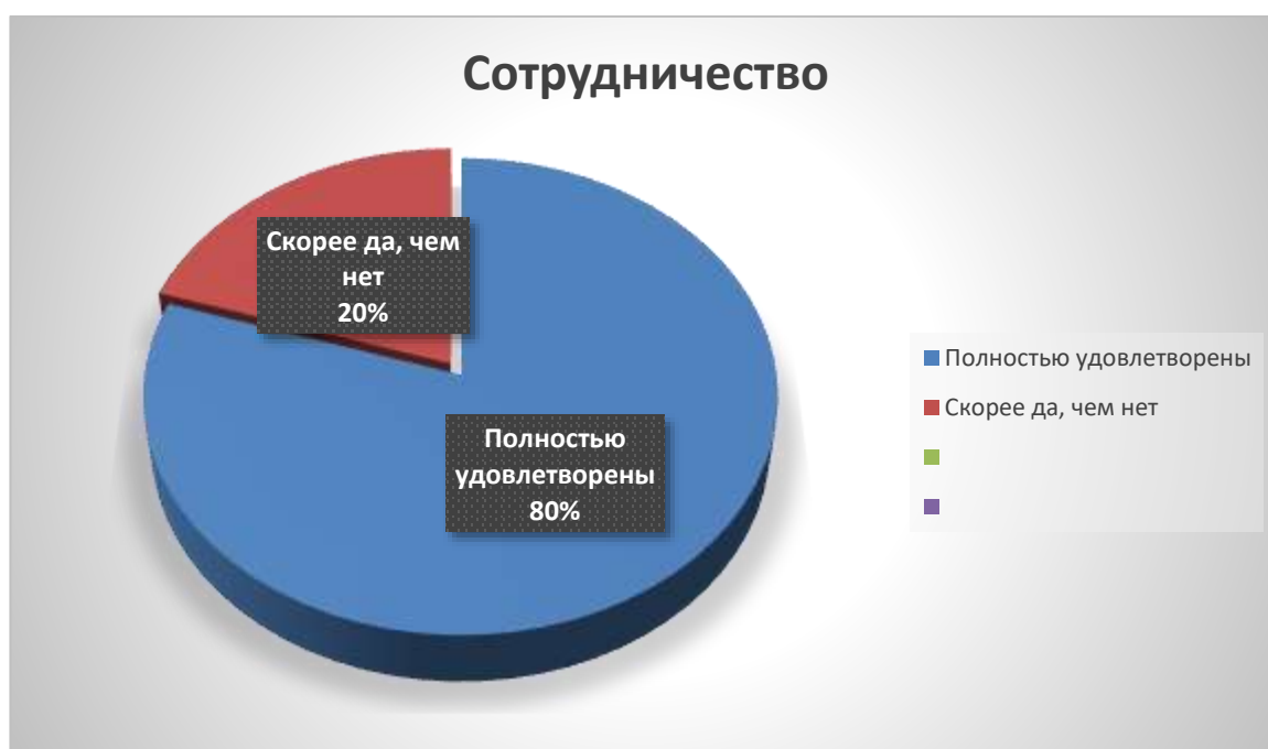
Рис. 1. Результаты удовлетворенности сотрудничеством

На первый вопрос «1. Удовлетворены ли Вы сотрудничеством с ГБПОУ СО «Ивантеевский политехнический лицей?»» 80% работодателей полностью удовлетворены сотрудничеством, 20% скорее удовлетворены сотрудничеством.