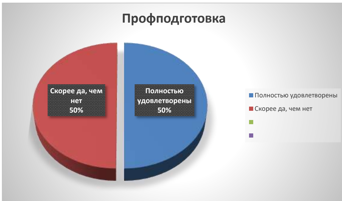
Рис. 2. Результаты удовлетворенности качеством профессиональной подготовки студентов (выпускников)

На вопрос «Удовлетворены ли вы качеством профессиональной подготовки студентов (выпускников)?» ответили, что 50% полностью удовлетворены, 50% скорее удовлетворен.