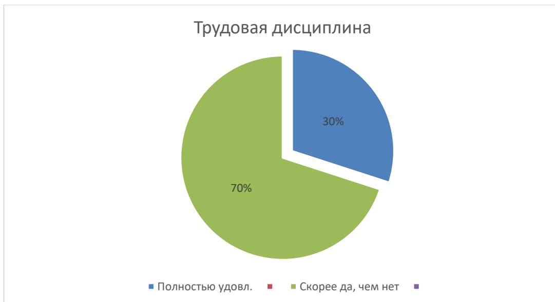
Рис. 5. Результаты удовлетворенности трудовой дисциплиной

На вопрос «Удовлетворены ли Вы трудовой дисциплиной студентов (выпускников)?» - 60% полностью удовлетворены, так же 40% ответили, что скорее удовлетворены.