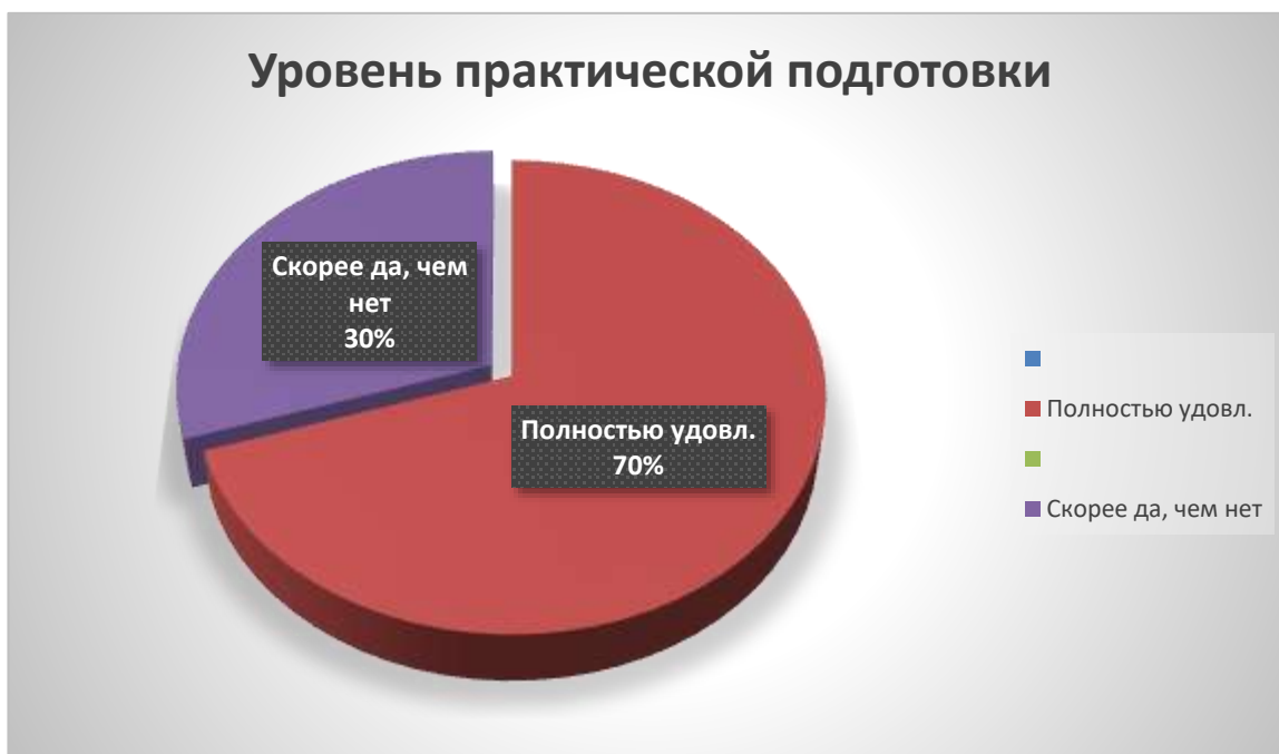
Рис. 4. Результат оценивания практической подготовки студентов (выпускников)

На вопрос «Как Вы оцениваете практическую подготовку студентов (выпускников)?» дали следующие ответы: 70% полностью удовлетворены, так же 30% ответили, что скорее удовлетворены.