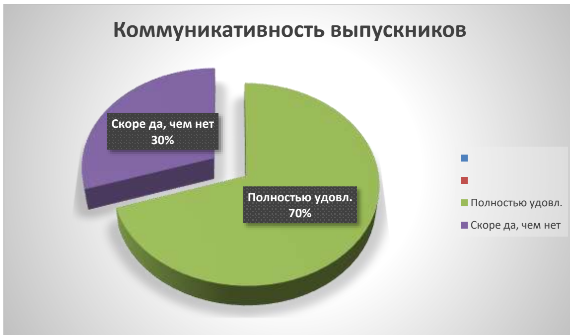
Рис. 6. Результат удовлетворенности коммуникативными качествами студентов (выпускников)

На вопрос «Удовлетворены ли Вы коммуникативными качествами студентов (выпускников)?» - 70% полностью удовлетворены коммуникативными качествами студентов (выпускников), а 30% скорее удовлетворены.