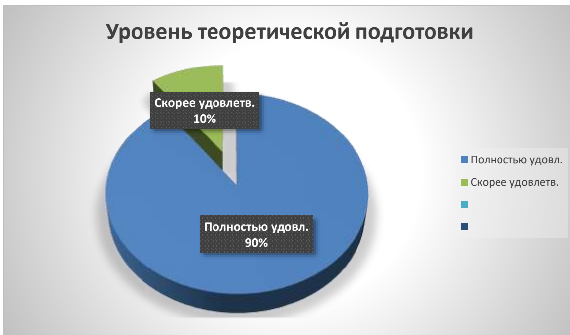
Рис. 3. Результаты оценивания уровня теоретической подготовки студентов (выпускников)

На вопрос «Как Вы оцениваете уровень теоретической подготовки студентов (выпускников)?» - дали следующие ответы: 92% полностью удовлетворены, а 8% скорее удовлетворен теоретической подготовкой студентов (выпускников).